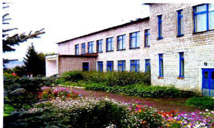
Акбулатовская средняя школа

Новоакбулатовская средняя школа основана в 1906 году, как земская начальная школа. В годы ВОВ школа стала семилетней, а сначала 60-ых годов – восьмилетней. С 1987 года, после постройки Нового здания, школа была преобразована в среднюю.