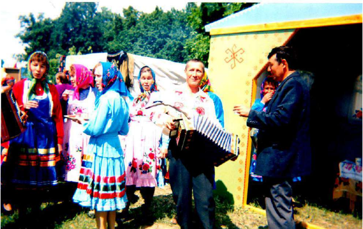
Районный сабантуй. Мы всегда рады гостям.