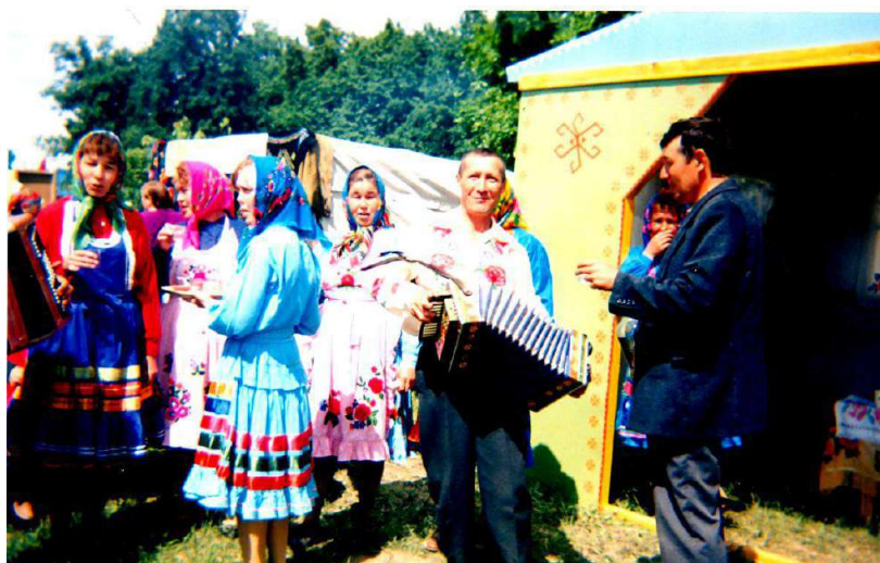
Районный сабантуй. Мы всегда рады гостям.