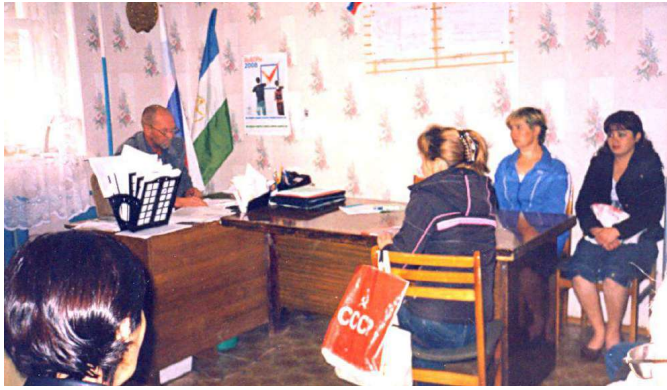
Совещание при главе