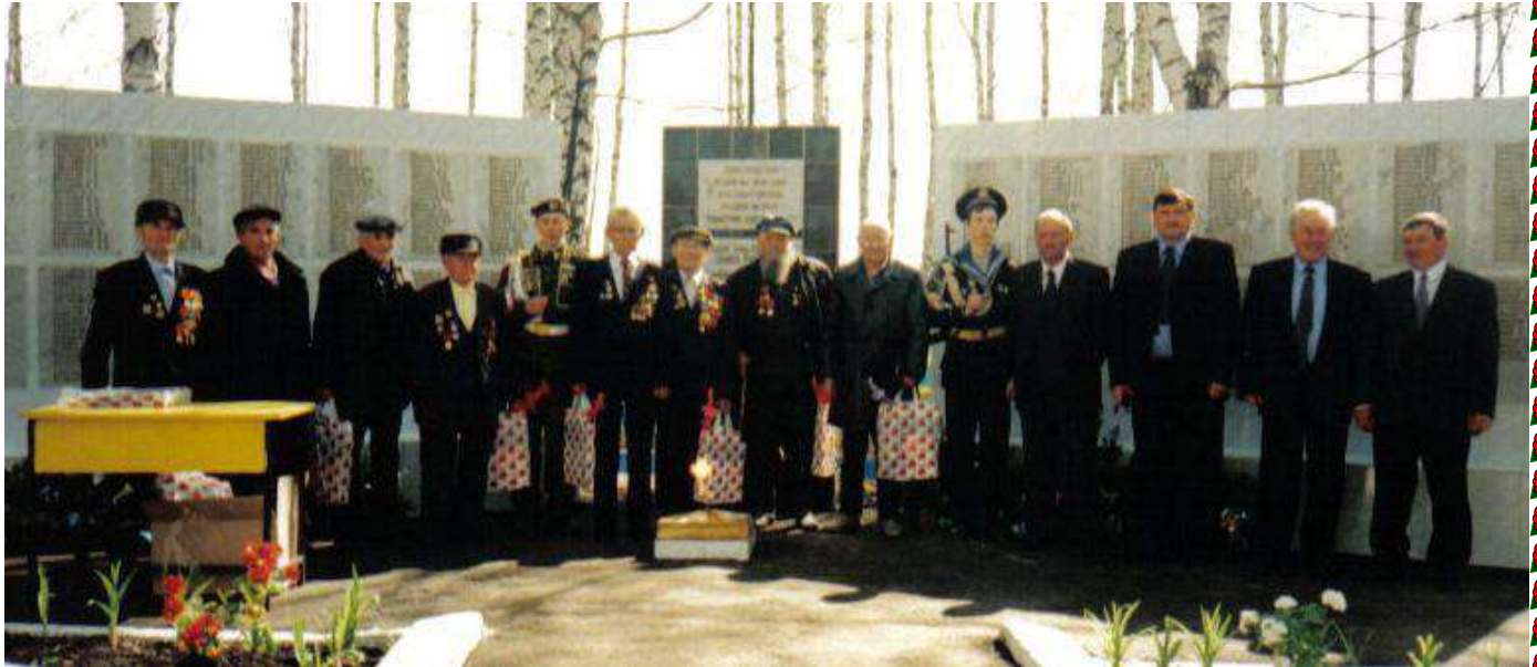
Открытие памятника. 2005 год.