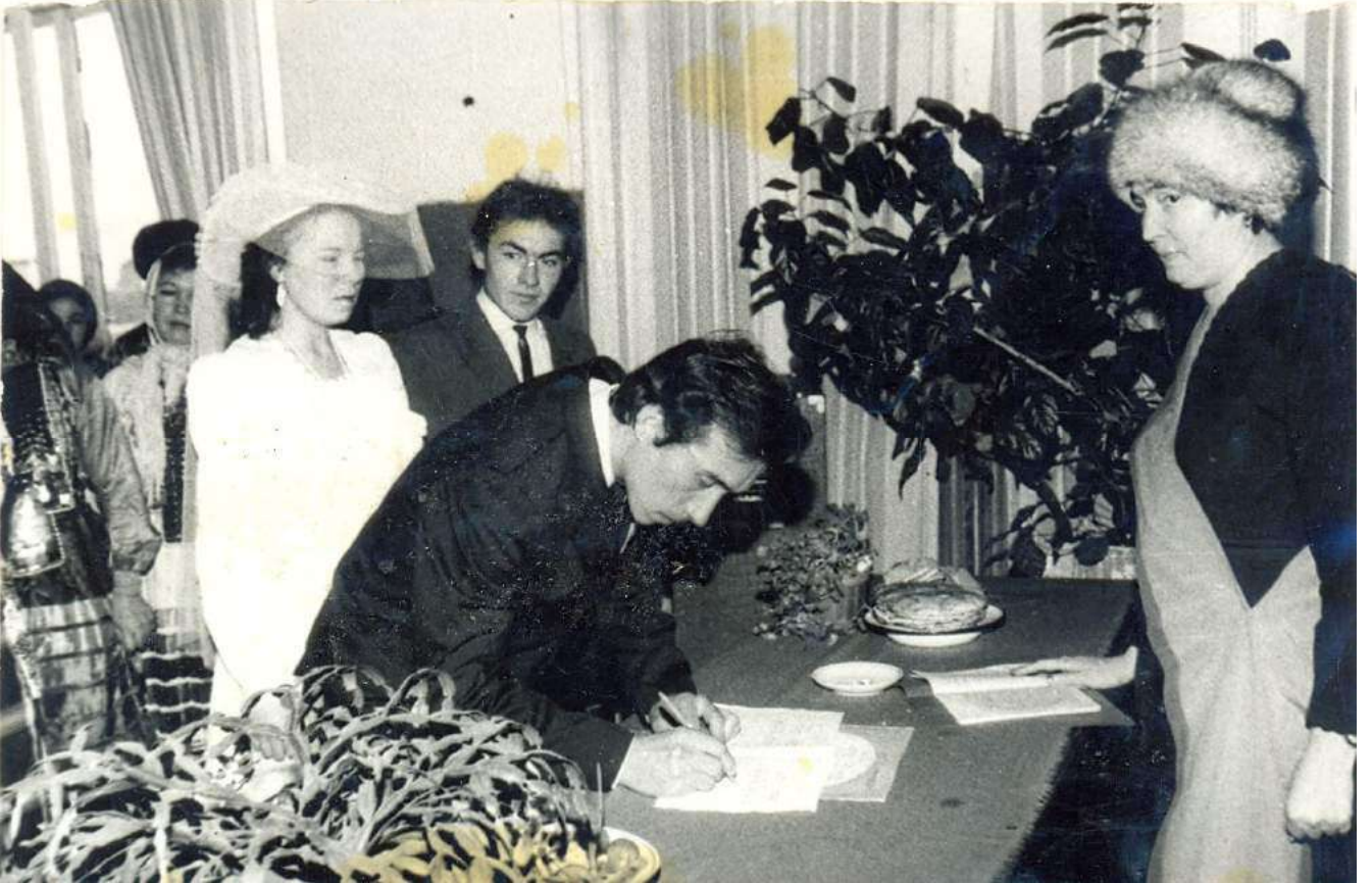
Во время регистрации брака