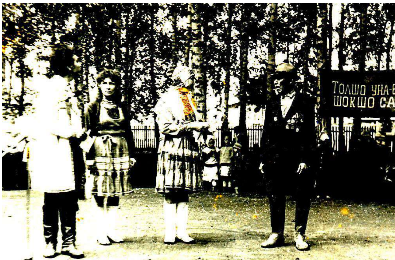
Праздник деревни 1992 год.