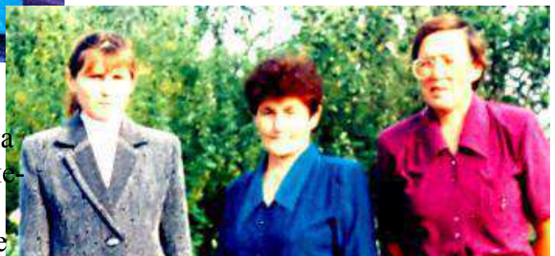
Коллектив Яндыгановской начальной школы.

Яндыгановская начальная школа образована в 1893 году, принадлежала Министерству народных училищ. Ежегодно в этой школе обучаются более 30 учащихся.