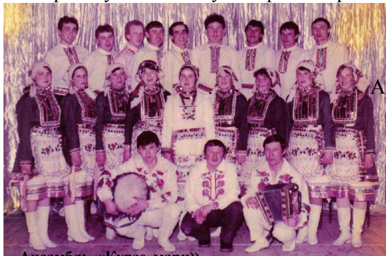
Ансамбль «Күрзе мари»

Богата и разнообразна культурная жизнь акбулатовцев. Жители сельсовета стремятся не только сохранить, но и обогатить культурное наследие своих предков. Хорошо известен не только в районе, но и за его пределами народный ансамбль танца « Күрзе мари », который начал свою работу в 1987 году как фольклорный коллектив. Будучи