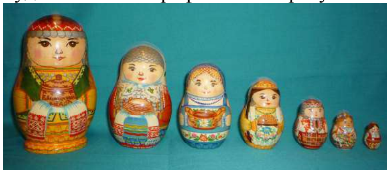
« Семь сестер»