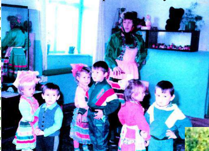
Праздник в детском садике

Целью работы коллектива школы является – создание среды развития и индивидуальных способностей каждого ребенка, формирование творчески мыслящей личности, способной адаптироваться к условиям современной жизни.