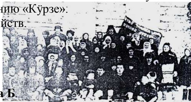
колхозники колхоза «Күрзе»