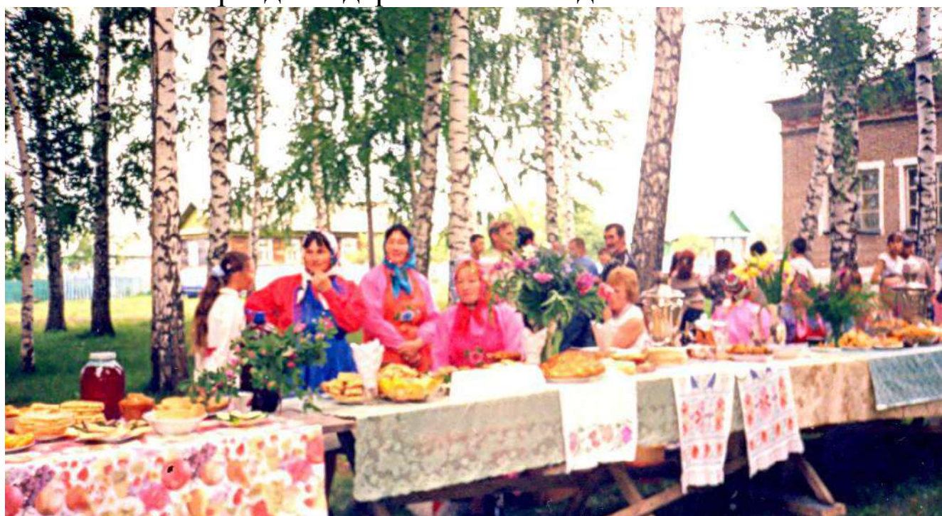
Праздник сабантуй. 2009г.