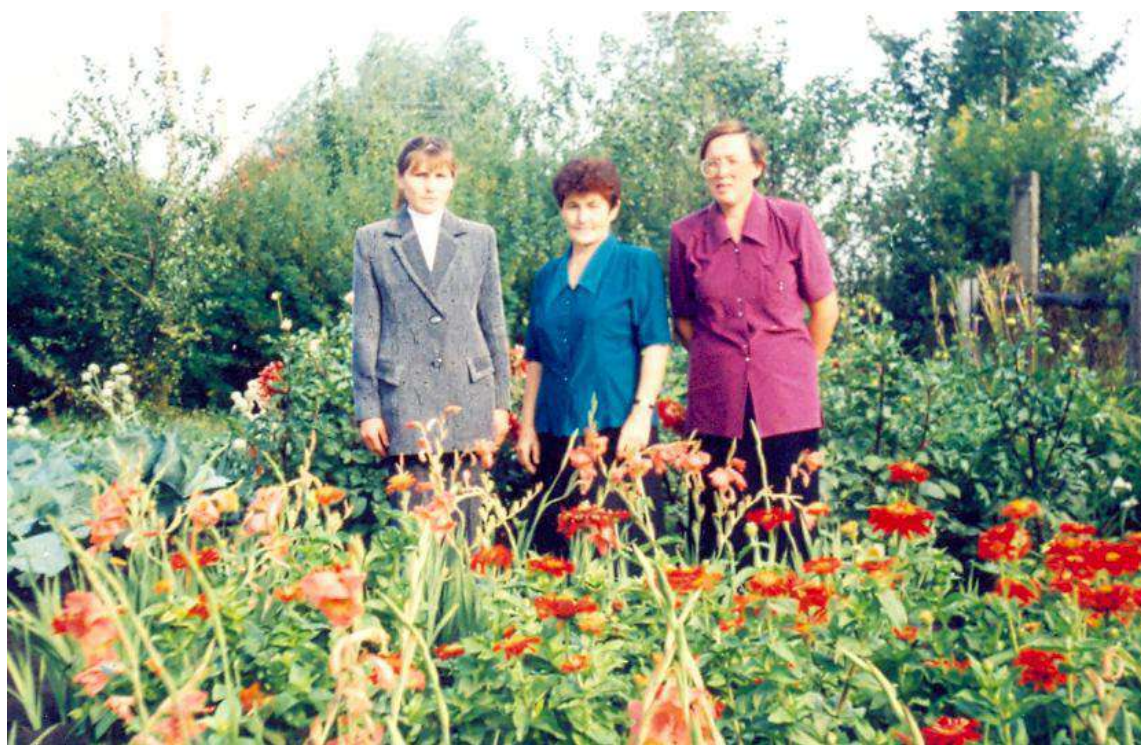
В школьном саду.