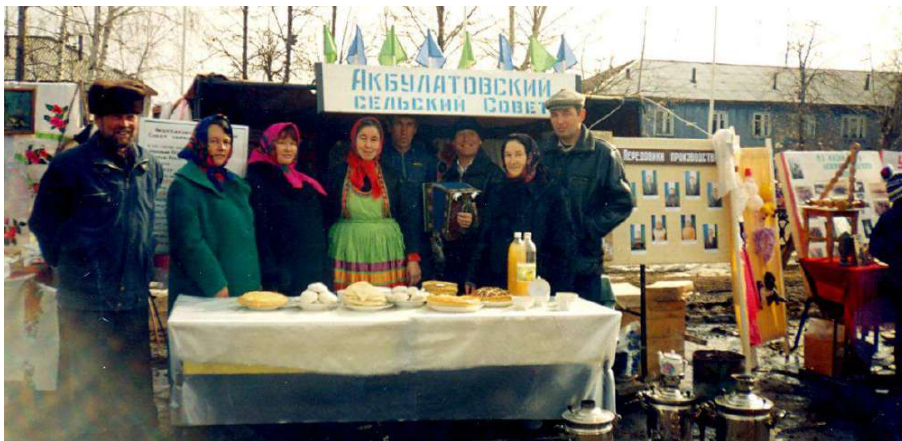
«На рубеже тысячелетий» Праздник в райцентре.