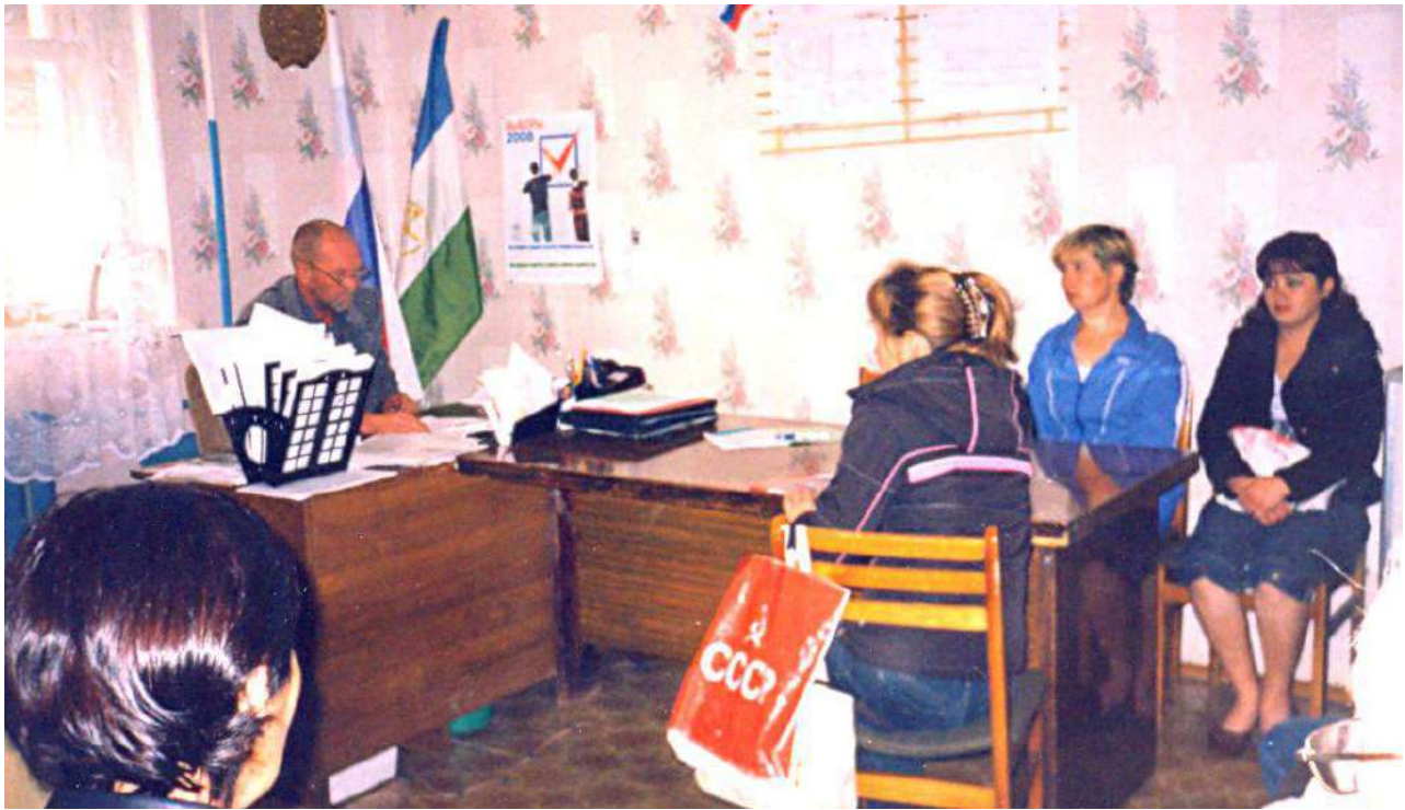
Совещание при главе.