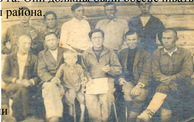
Актив хозяйства 1948г.

заложены питомники. В колхозе им Карла Маркса 0,30 га. Они должны были обеспечивать все колхозы района.